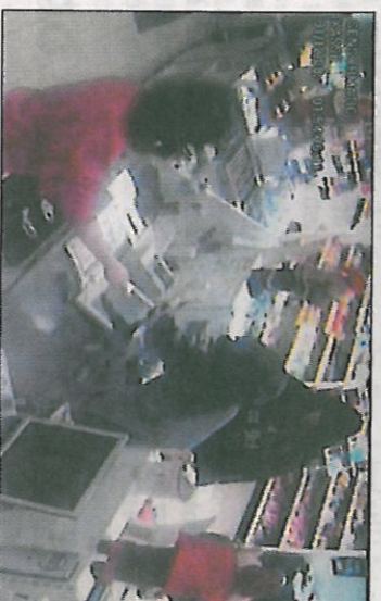
TRE DØMT: Brødreparet utgjør to av de tre som er dømt for det ranet på Sundjordet.

To brødre på 23 og 25 år er dømt for ranet på Esso under Frednesbrua nyttårsaften.